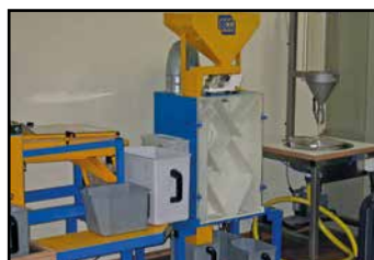
los controles de aire permiten modificar flujo de aire de acuerdo a especie