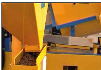
las semillas viajan por vibración