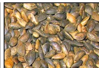
se pueden procesar una gran variedad de especies