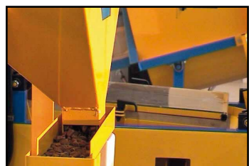
Семена подаются с помощью вибрации