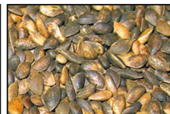
Возможно обрабатывать широкий спектр семян