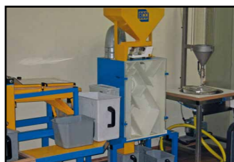
Воздушная перегородка для регулирования воздушного потока для семян разных древесных пород