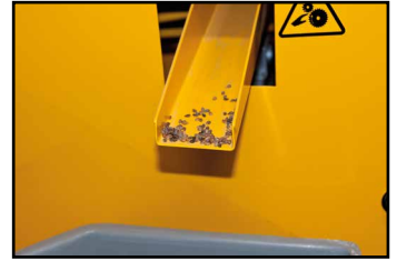
el lote se separa en 3 fracciones