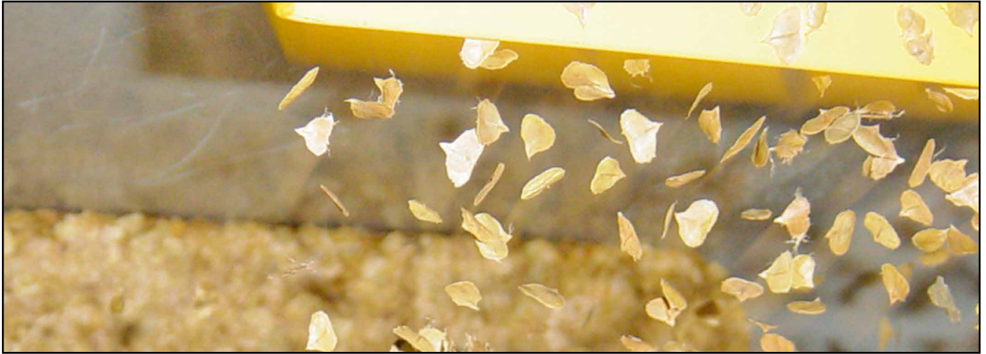
el canal de aspiración remueve partículas ligeras