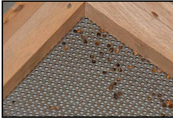
cribas con perforaciones redondas